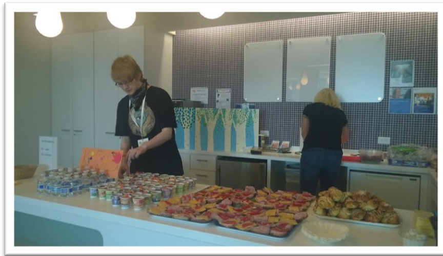
Vapaaehtoisest tekemässä ja tarjoilemassa Suomi-koululaisille välipalaa