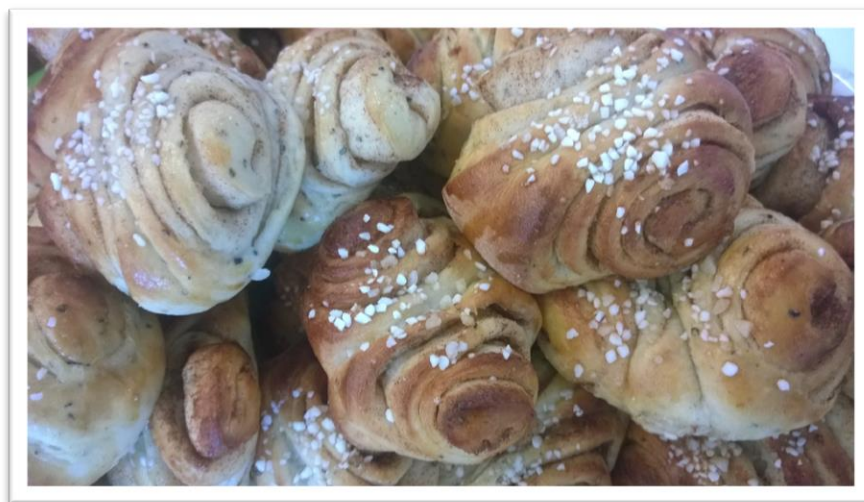
Erään vapaaehtoisen leipomaa pullaa