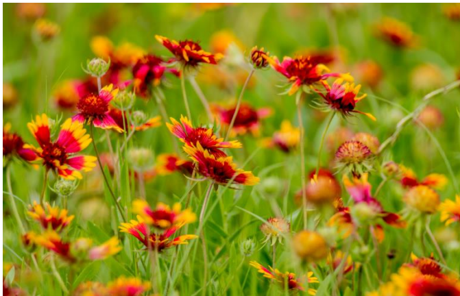
Firewheels Trinity jokirannassa toukokuun lopussa. Hieno kirkkaan punainen ja keltainen kukka.