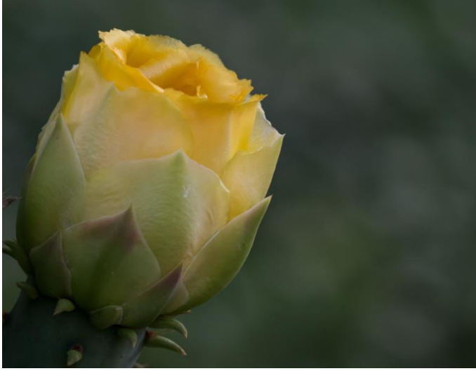
Prickle Pear Cactus kukkii toukokuun aikana komeasti keltaisena. Nupussa on enemmän väriä kuin itse kukassa. Yksi yleisimmistä kaktuksista alueellamme, kukinta aika hyvin lyhyt.