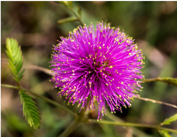
Sensitive Briar oli yksi viime kevään sateiden tuotteita, todella kaunis pieni kukka. Tämä on kuvattu Iredellissä, monet kuvistani ovat sieltä. Villikukat vaihtelevat luonnossa viikosta toiseen. Kuvani ovat otettu Canon 70D kameralla ja hyvin läheltä kukkaa.