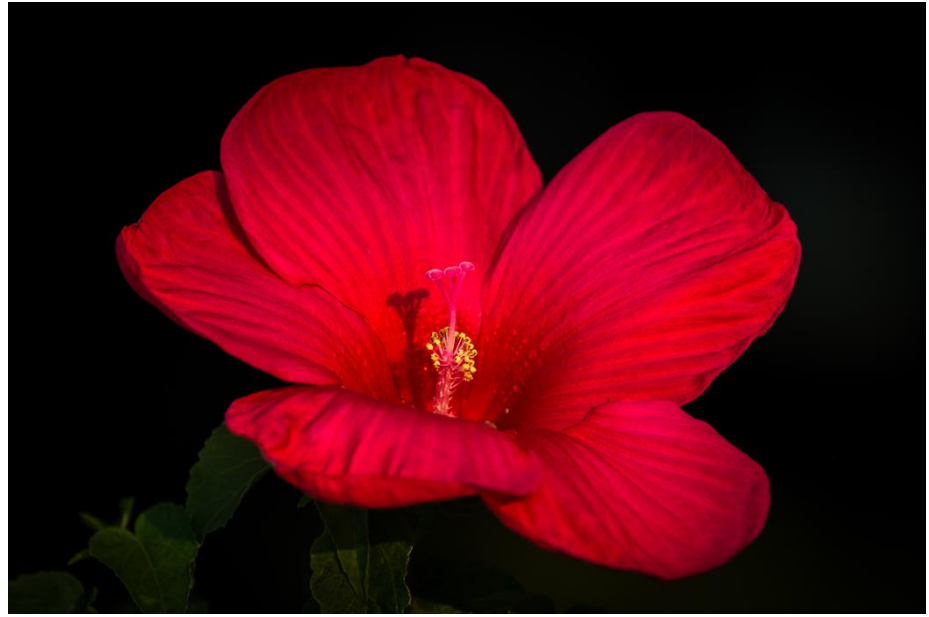
Hibiscus ei ole luonnossa vapaasti kasvava, laitan sen kuitenkin tähän koska niitä näkyy niin paljon juuri nyt. Suuri joko keltainen tai punainen kukka, joka on auki vain näivällä