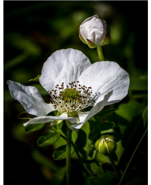
Blackberry kukkii keväällä ja kasvaa alueellamme villinä. Kuva otettu Fort Worth Nature Centerin alueella.