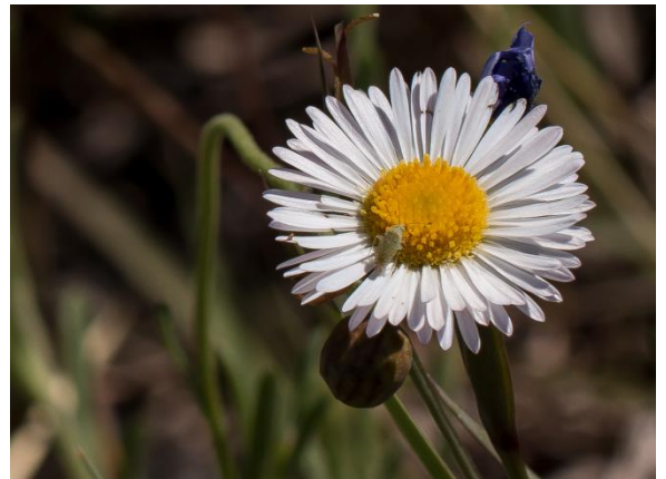
Laisy Daisy on tienvarsien kukka, pieni moniterälehtinen. Tämä kuva on otettu Hicossa ojan penkereeltä.