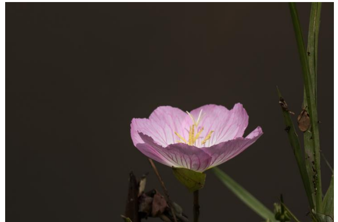
Pink Evening Rose kuvattu Dallasissa Bachman järven rannalla, aivan Love Field lentokentän lähellä.