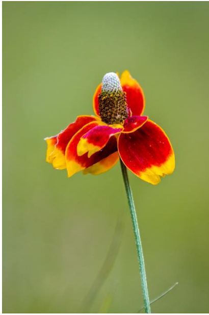
Mexican Hat on kaunis värikäs kukka. Tämä kasvoi Trinity joen partaalla.