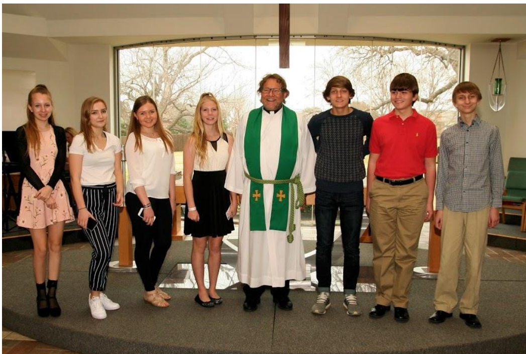
Vuoden 2017 Rippikouluryhmä