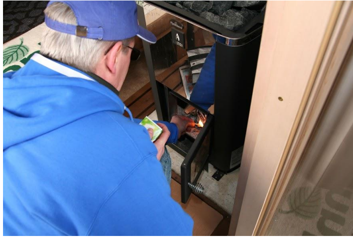
Näin sytty Traveling Saunan kiuas