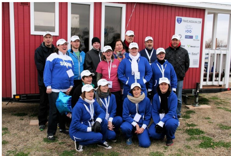
Onnittelulaulu 100-vuotiaalle Suomelle