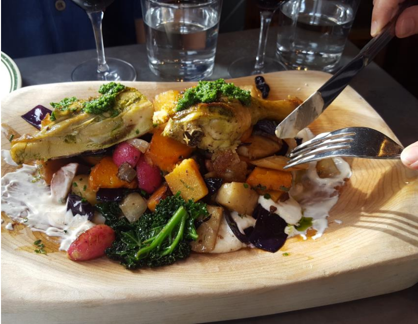
Kanaa ja vihanneksia

ja muutenkin menút olivat ranskankielisiä ja -tyylisiä. Juustoja ei syödä alkupalaksi viinin kanssa, vaan aterian päätteeksi.