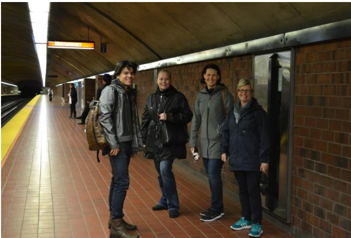
Metrossa matkalla jonnekin

Kiitos Montrealin Suomi-koulun ison ponnistuksen sekä Kone Konsernin $4000 koulutuspäivätuen, pääsi Pohjois-Teksasin Suomikoulusta lähtemään 7 halukasta ohjaajaa ja hallituksen jäsentä kuulemaan ja oppimaan suomenkielen opetuksen uusia tuulia sekä verkostoitumaan 7 muun Pohjois-Amerikan Suomikoulun kanssa!