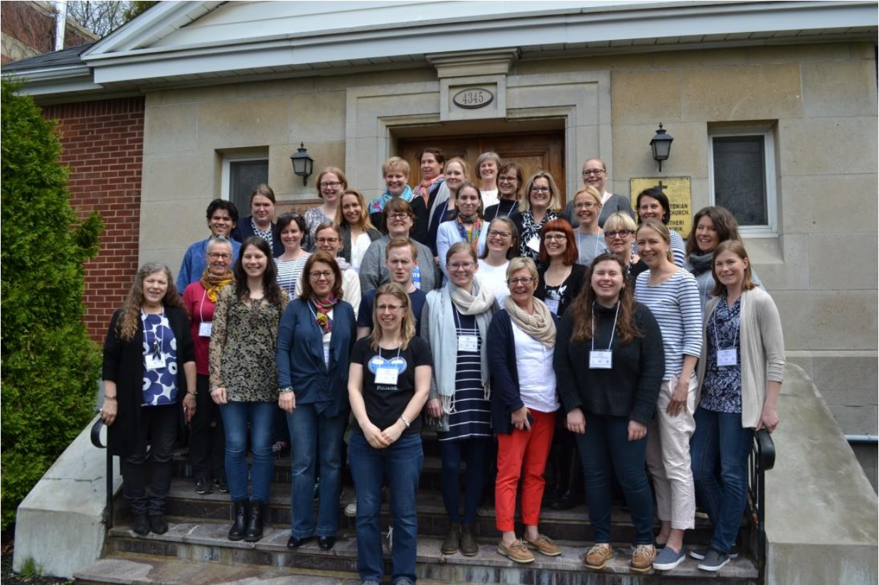
Montrealin Suomi-koulujen koulutuspäiville osallistujien iloinen joukko

Meistä kaikista osallistujista koulutuspaivat olivat antoisat ja opimme paljon uutta ja saimme vahvistusta aikaisemmin oppittuun sekä aivan uutta tietoa kielenopiskelusta. Meidän kaikkien toivomuksena on päästä taas seuraaville Pohjois-Amerikassa järjestettäville koulutuspäiville! Toivottavasti sellaiset järjestetään pian ja meillä on mahdollisuus osallistua niille!