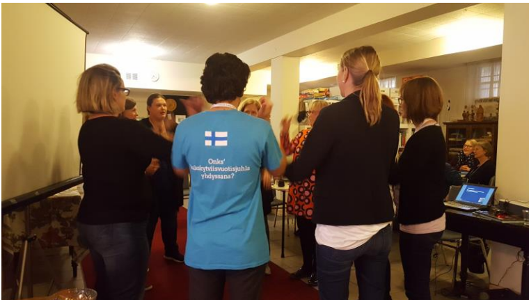
Ryhmätyöpajoja ja uusien oppien testaamista käytännössä