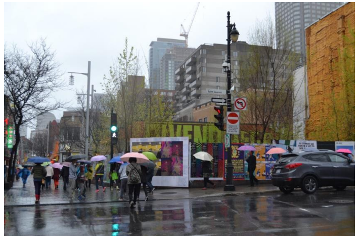
Sateinen Montreal ja värikkäät sateenvarjot

Koulutuspäivien lisäksi ehdimme tutustua Montrealin kaupunkiin, joka oli kaikin puolin kiinnostava! Montreal ei ole mikään kiiltokuvamainen kaupunki, vaan rouhea ja eläväinen, oman karaktääriin omaava moniulotteinen paikka. Kaupungin vilinässä, puistojen lomassa ja kaupungin osien muuttuessa silmä näkee kävelijöitä ja juoksijoita. Ohi vilahtaa skeittaria, pyöräilijöitä ja rullaluistelijoita. On nuoria makoilemassa puisto-picnicillä, on lapsia käyttäen itsenäisesti julkista liikennettä, on taiteilijaa, ja on vaan yksinkertaisesti paljon erilaisia ihmisiä nauttimassa kaupungin hyvästä tunteesta ja sykkeestä. Matkallamme huomasimme, että Montreal on kaunis sattellakin ;) Sateen sattuessa kannattaa vierailla esimerkiksi uskomattoman kauniissa Notre Damessa!