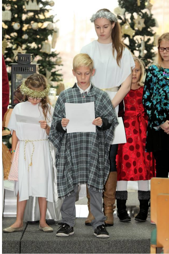
Joulu evankeliumin suomeksi