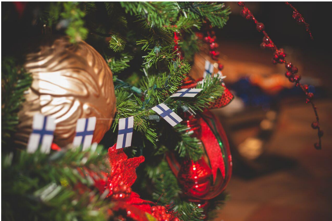
Suomenliput kuusessa