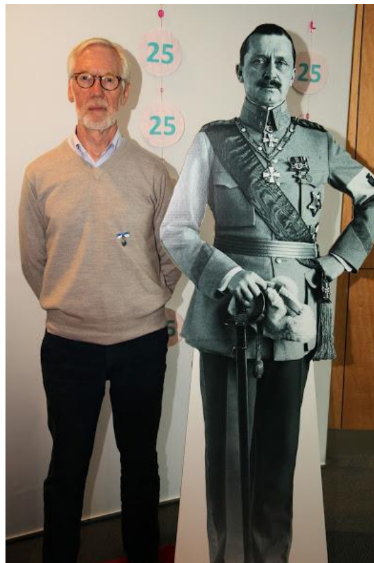
Walfrid Huskonen Wall of Fame. Ilä.