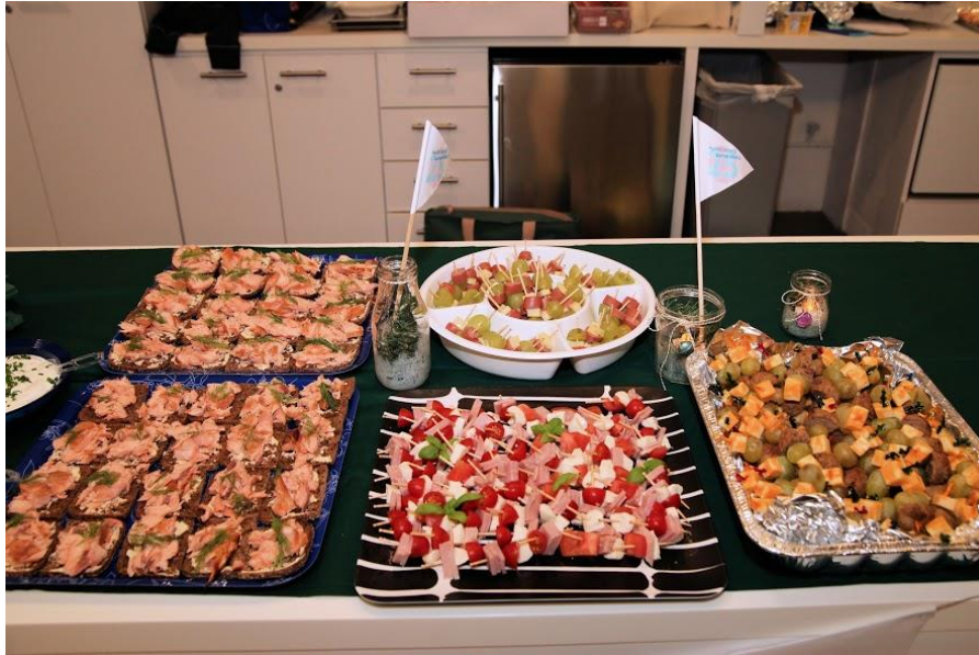
Lohivoileipiä, coctail-tikkuja, karjalanpiirakoita ja vaikka mitä suomalaisia herkuja