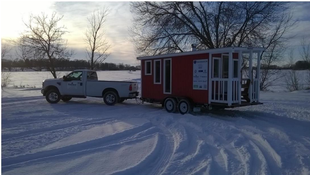
Sisu-sauna valmiina lähtöön USAn kiertoon ja kohti Dallasia.

Lisää Traveling Sauna-infoa http://www.travelingsauna.com sekä MTV3 Katsomon Kymppiutisten kevennys 15.1.