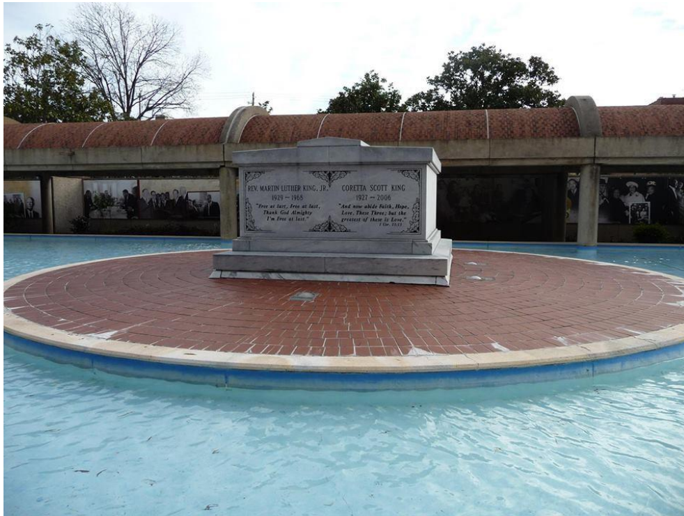
Martin Luther King, Jr. Memorial in Atlanta, Georgia